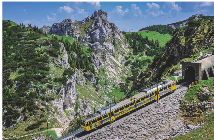
▲ Moderner Doppeltriebwagen (DTW)