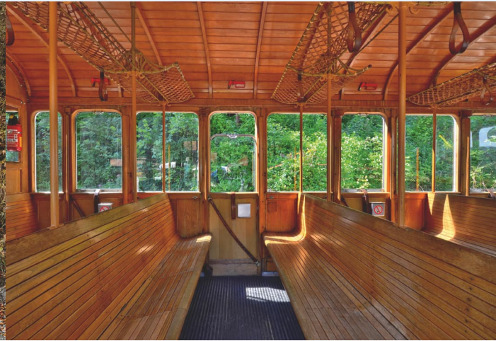
▲ Nostalgie-Express der Wendelsteinbahn: Lok 5 mit Personenwagen aus dem Jahr 1912

Nostalgie-Express fährt 2026 auch im Regelbetrieb! Von Mai bis Oktober jeden ersten Freitag. Buchbar über Online-Shop. Außerhalb der fahrplanmäßigen Betriebszeiten haben Sie die Möglichkeit einen Sonderzug (Nostalgiebahn oder moderner Doppeltriebwagen = DTW) oder eine Sondergondel für Ihre privaten Veranstaltungen oder Betriebsfeiern zu buchen.